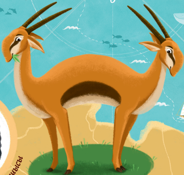
Екі басты қарақұйрық