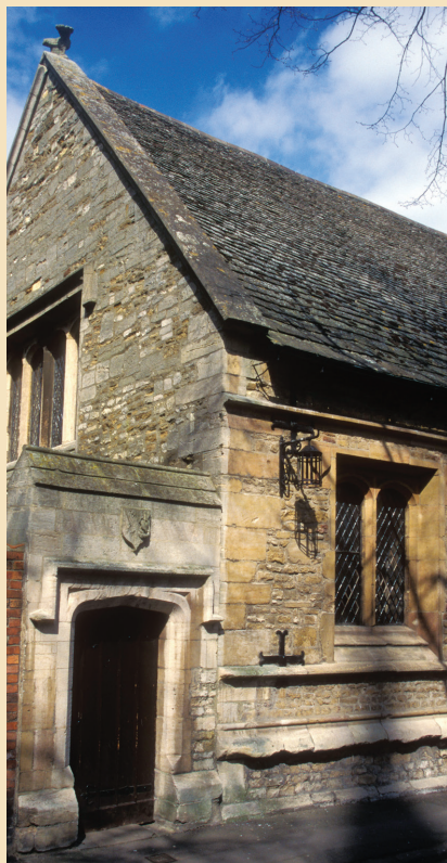
▲ Ньютонның балалық мектебі әлі де бар.

Ньютонның анасы оның фермер болғанын қалады. Анасының көңілінен қарап,