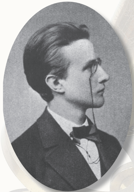
↑ Планктың жас кезі

Макс Карл Эрнст Людвиг Планк 1858 жылы 23 сәуірде дүниеге келген. Бұл кезде адамдар өзін ғылымдағы барлық мәселенің шешімін таптық деп ойлайтын. Планктың мұғалімдері оған ғылымды оқудың еш мәні жоқ екендігін айтатын. Олардың ойынша ғылымда енді оқып үйренетін ештеңе қалмаған! Оның орнына математиканы оқу керек.