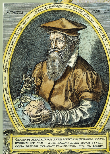
↑ Герардус Меркатор

Дегенмен Меркатор жасаған картадан қате шықты. Картада полюстерге жақын орналасқан жерлердің пішіні мен өлшемі дұрыс емес көрсетілген. Еуропа мен Солтүстік Америка Африкадан үлкен етіп сызылған. Ал шын мәнінде, Африка екеуінен де әлдеқайда үлкен!